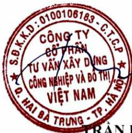
TRẦN HUY ÁNH